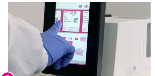
1 8" Touchscreen