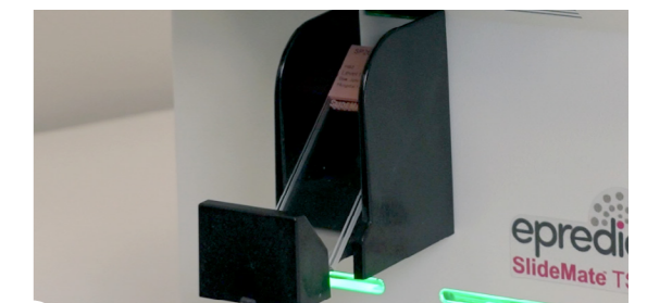
4 Objektträger-Sammelschacht (max. 13 OT)